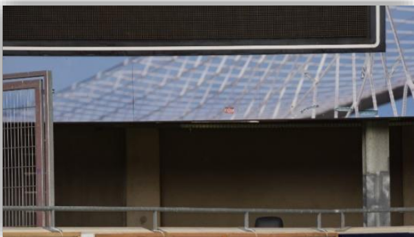
3 Rollstuhlfahrerplätze neben dem Gästeblock, an der Videowand.

*Zur Einfahrt berechtigt sind Personen und deren PKW mit „blauem Parkausweis“.