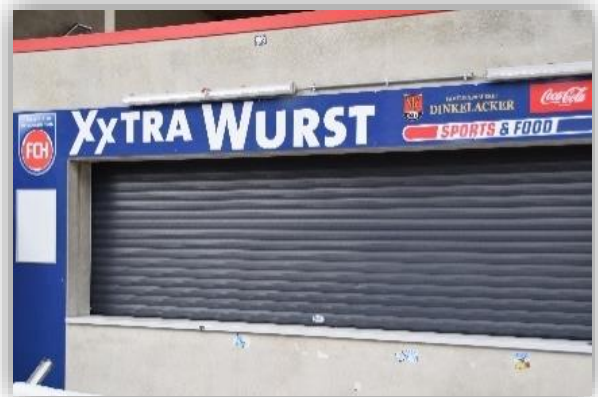
Einer der Kioske