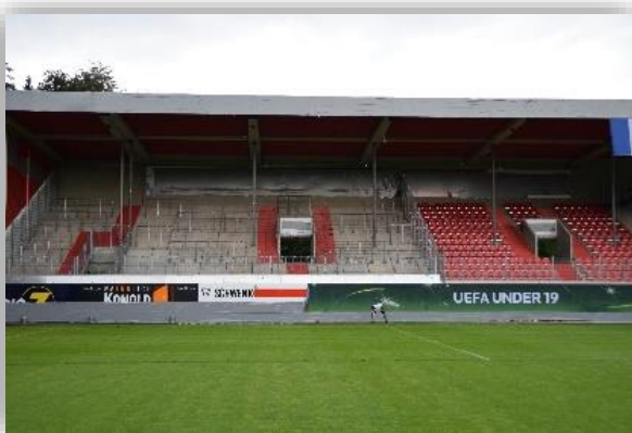
Gästeblock von innen

Wir bitten um Freihaltung der rot markierten Treppen im gesamten Gästeblock, da es sich hierbei um Fluchtwege handelt.